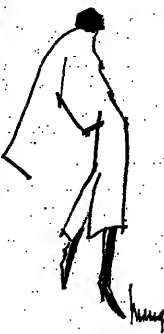
Silhouette 15-16 en haute couture, vue par Marcq.